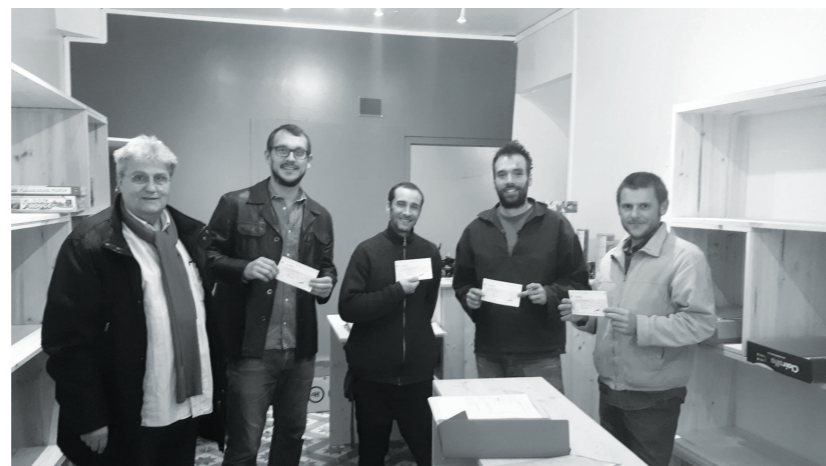
Remise du chèque Initiative France