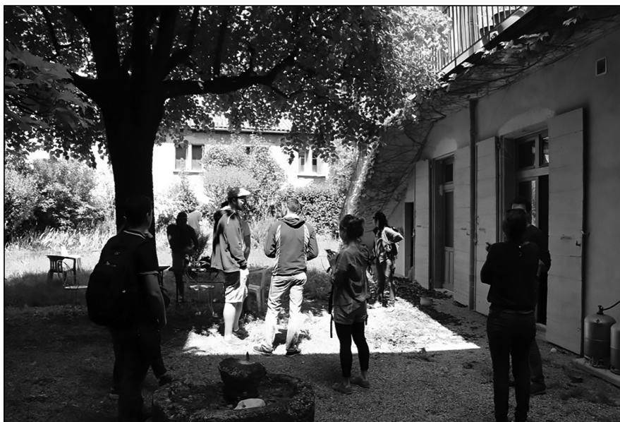
Photos : L'Avant Poste, rénovation en tiers-lieu d'une ancienne maison d'habitation au cœur d'une Petite ville de demain (Die, Drôme) de 800 m 2