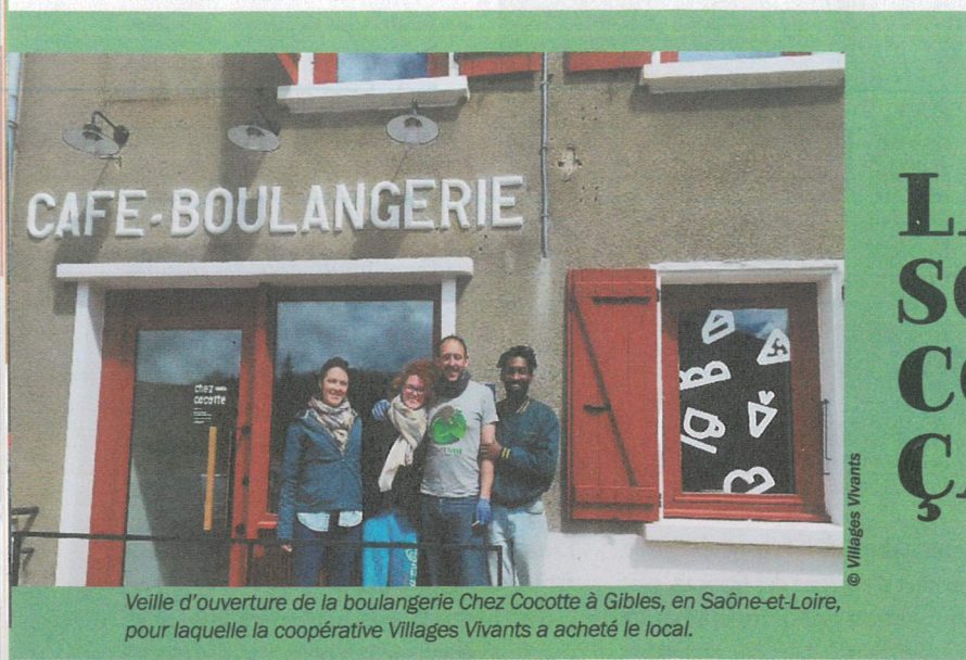
Veille d'ouverture de la boulangerie Chez Cocotte à Gibles, en Saône-et-Loire, pour laquelle la coopérative Villages Vivants a acheté le local.